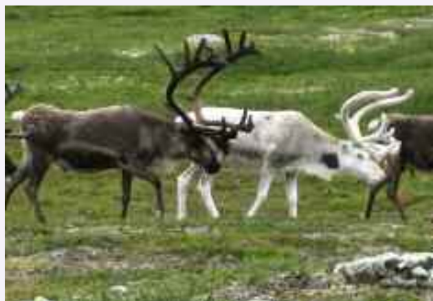
Il tradizionale allevamento delle renne.

La capitale è Stoccolma, città costruita su centinaia di isole del Mar Baltico. Con 800.000 abitanti, è il centro economico e culturale della Svezia ed è una delle città meno inquinate del mondo.