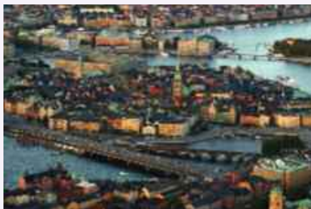
Stoccolma, centro economico e culturale della Svezia.

Con i suoi 449.964 km 2 di superficie, la Svezia è il quinto paese più esteso d'Europa dopo Russia, Ucraina, Francia e Spagna. Si estende per una lunghezza di oltre 1500 chilometri in linea d'aria da Nord a Sud. Con circa 9 milioni di abitanti, la densità di popolazione è comunque generalmente bassa ed è concentrata nelle città. L'interno è per buona parte occupato da estese foreste. È un Paese dalle grandi risorse naturali (legname, minerali ferrosi, acqua) e di imprese ad alta tecnologia che consentono agli Svedesi un elevato tenore di vita, con un reddito pro capite di circa