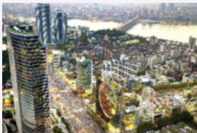
Seul, capitale e centro economico della Corea del Sud.

Dopo la Guerra di Corea (1950-1953) il PIL pro capite era allo stesso livello dei più poveri paesi dell'Africa e dell'Asia. Oggi il PIL pro capite sudcoreano è di circa venti volte più alto di quello della Corea del Nord e supera