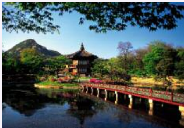
Hyangwonjeong Pavilion, Kyongbok Palace, Seul.

Per chi apprezza la cultura urbana, le città coreane sono molto interessanti, in particolare l'immensa Seul. Secondo i dati del servizio demografico ONU, l'area urbana di Seul contava 10,3 milioni di abitanti nel 2007, posizionandosi al ventiduesimo posto nella classifica delle città più popolate. I dati cambiano notevolmente se si prendono in considerazione i sobborghi, tra cui il maggiore porto, Incheon e il più grande centro residenziale,