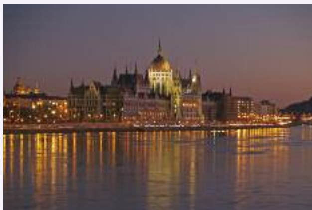
Budapest. Il parlamento.

La lingua ufficiale della Repubblica d'Ungheria è l'Ungherese di ceppo ugro-finnico. È una lingua poco conosciuta, così già nelle