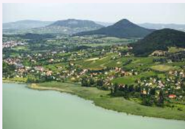
Il lago Balaton ed i suoi vigneti.

L'economia ungherese è in stato di agitazione, e a differenza di altri mercati dell'Europa centrale e orientale, sta lottando per combattere l'impatto della recessione. Nel 2009, il Prodotto Interno Lordo è diminuito di oltre il 6%, e questo è stato il più grande declino dalla fine della Guerra Fredda. Il 2010 ha visto una lieve ripresa dell'economia, ma nonostante l'andamento relativamente positivo, le vendite al dettaglio continuano a soffrire e l'indice di fiducia dei consumatori è in calo costante dal settembre 2010.